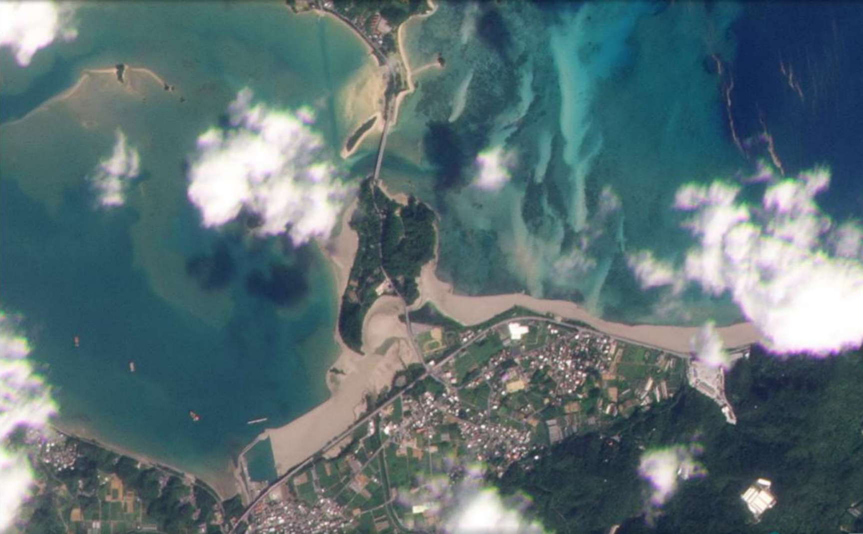
新たな軽石が漂着