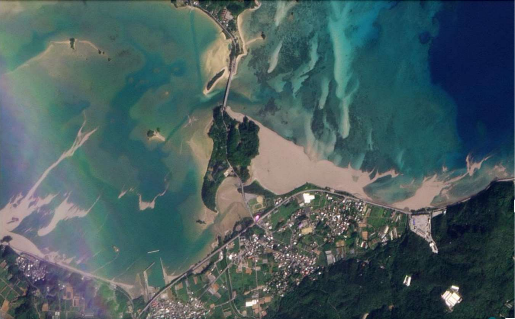
新たな軽石が漂着