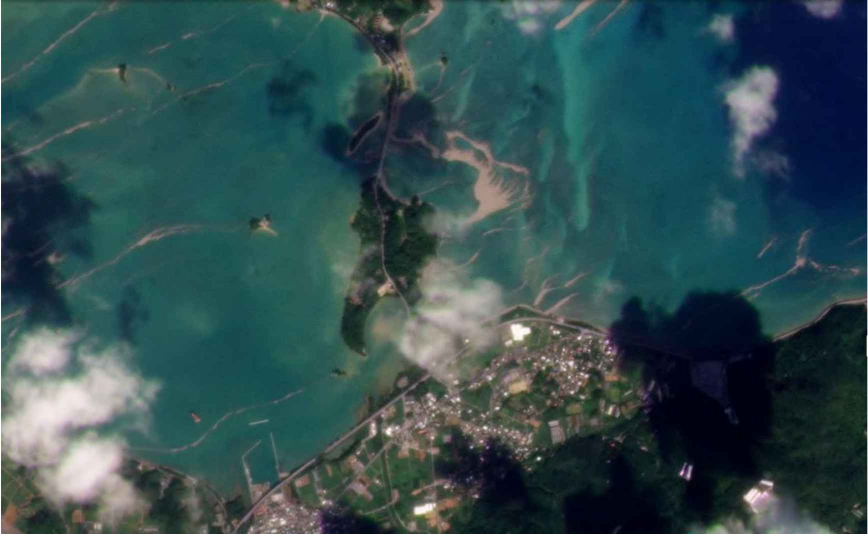
住民が軽石を除去