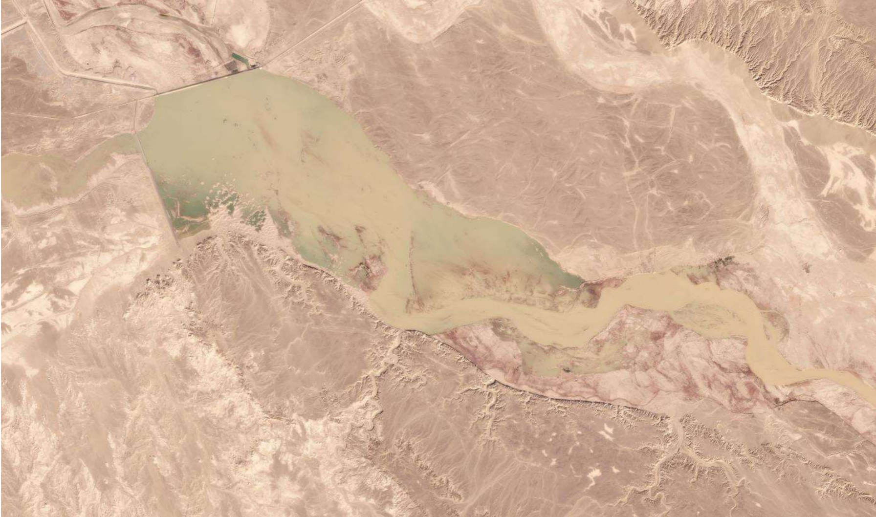
貯水池に水が溜まっている