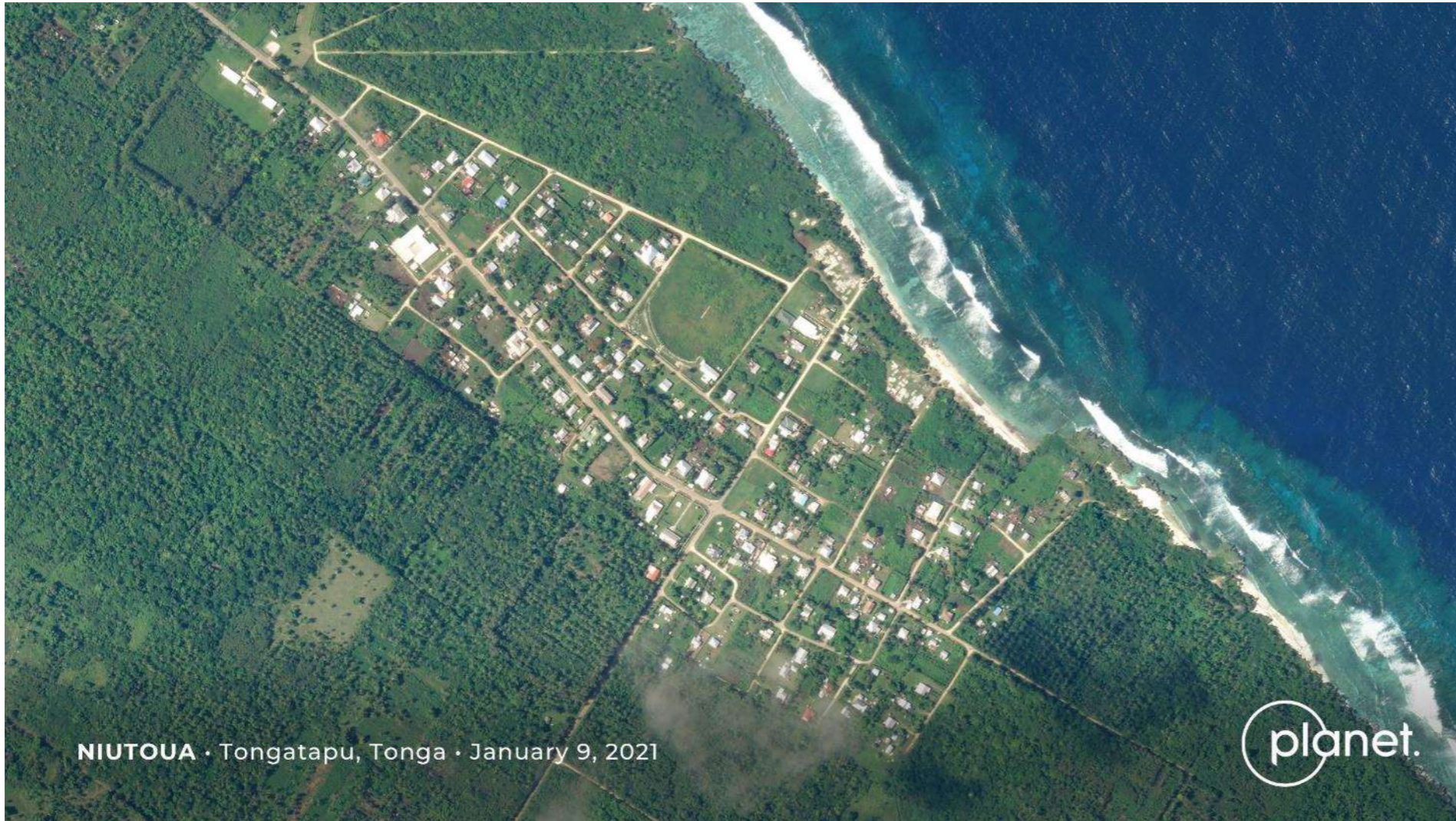
火山噴火前の街の様子

NIUTOUA · Tongatapu, Tonga · January 9, 2021