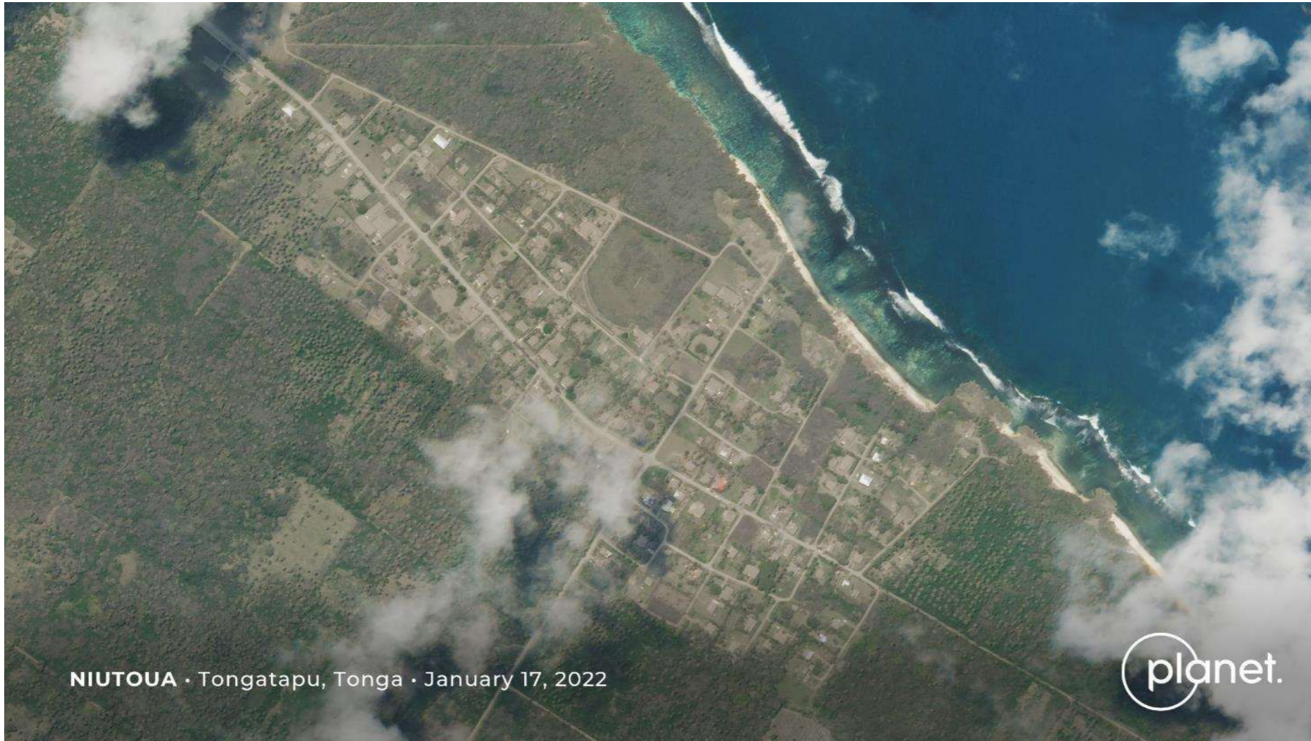
火山の噴火により、火山灰が降り積もった街の様子

NIUTOUA · Tongatapu, Tonga · January 17, 2022